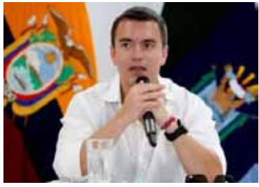
El presidente Daniel Noboa.

El presidente de Ecuador, Daniel Noboa, decretó un nuevo "estado de excepción" focalizado por 60 días en nueve provincias y tres municipios del país, por la "grave conmoción interna" provocada por el incremento de la violencia criminal.