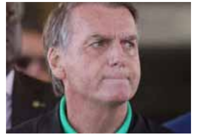
El expresidente brasileño Jair Bolsonaro.

El Tribunal Supremo Federal de Brasil rechazó la solicitud del expresidente Jair Bolsonaro de convertir su detención por intento de golpe de Estado en arresto domiciliario. Los abogados de Bolsonaro presentaron la petición el miércoles, alegando un "riesgo real de deterioro repentino" en la salud del exmandatario, según informó la agencia ANSA.