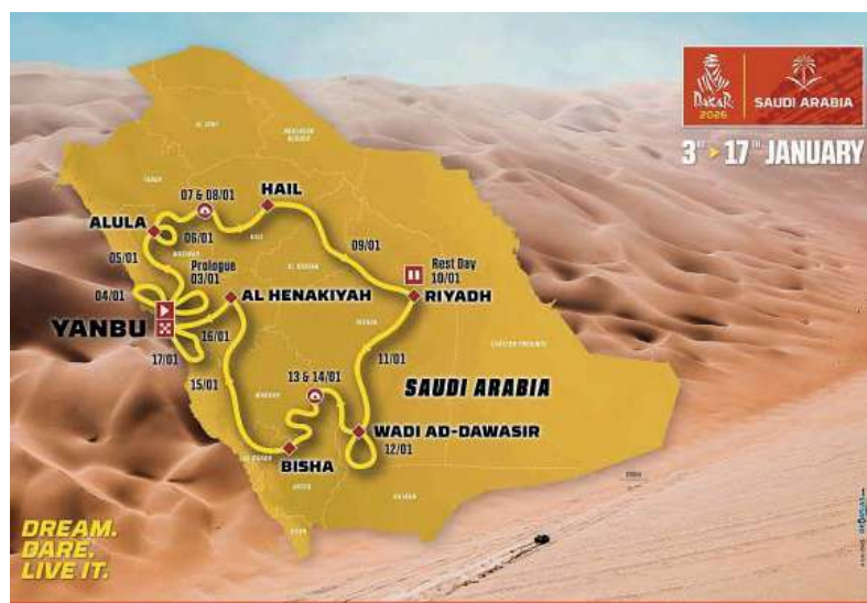
Recorrido. De Yanbu a Yanbu, el Dakar 2026.