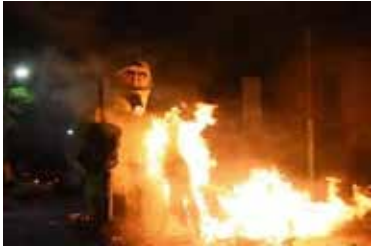
En 10 y 40, El Eternauta.

La Plata: la quema de muñecos volvió a marcar el 1º de enero