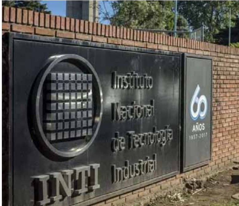
Menos atribuciones. El Instituto Nacional de Tecnología Industrial.

Entonces, "el servicio metrológico legal argentino cuenta con una oferta suficiente de laboratorios y organismos de certificación acreditados ante el OAA, que permite