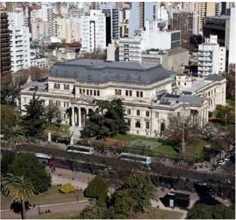
Horror. La Legislatura de la provincia de Buenos Aires.