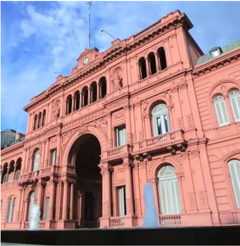
Al Boletín. El Gobierno reformará los servicios de inteligencia.

donde se desarrollen las actividades de inteligencia, ya sea en forma permanente, transitoria o circunstancial” “En el marco del desarrollo de actividades de inteligencia, auxilio o requerimiento judicial y/o comisión de delitos en flagrancia, el personal de inteligencia podrá proceder a la aprehensión de personas, debiendo dar aviso inmediato a las fuerzas policiales y de seguridad competentes”, agrega. Cambios varios Uno de los cambios impulsados por el DNU es que la Agencia de Seguridad pasará a llamarse Agencia Nacional de Contrainteligencia, la Agencia Federal de Ciberseguridad será reemplazada por la Agencia Federal de Ciberinteligencia y la División de Asuntos Internos, Inspectoría General de Inteligencia. Fuentes oficiales señalaron que la reforma “moderniza, ordena y legitima el Sistema de Inteligencia Nacional: lo integra al Estado, lo separa de funciones policiales, lo adapta a amenazas contemporáneas y lo somete a mayores controles, con el objetivo de mejorar la capacidad estratégica del Poder Ejecutivo”. Los voceros señalaron que los titulares de los órganos desconcentrados serán designados por el secretario de Inteligencia, reforzando la conducción jerárquica y el control interno del sistema. Aclararon que “el sistema no cumple tareas policiales ni judiciales, sino que produce inte-