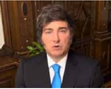
Video del presidente Javier Milei.

“Hemos cumplido todas las promesas de campaña”