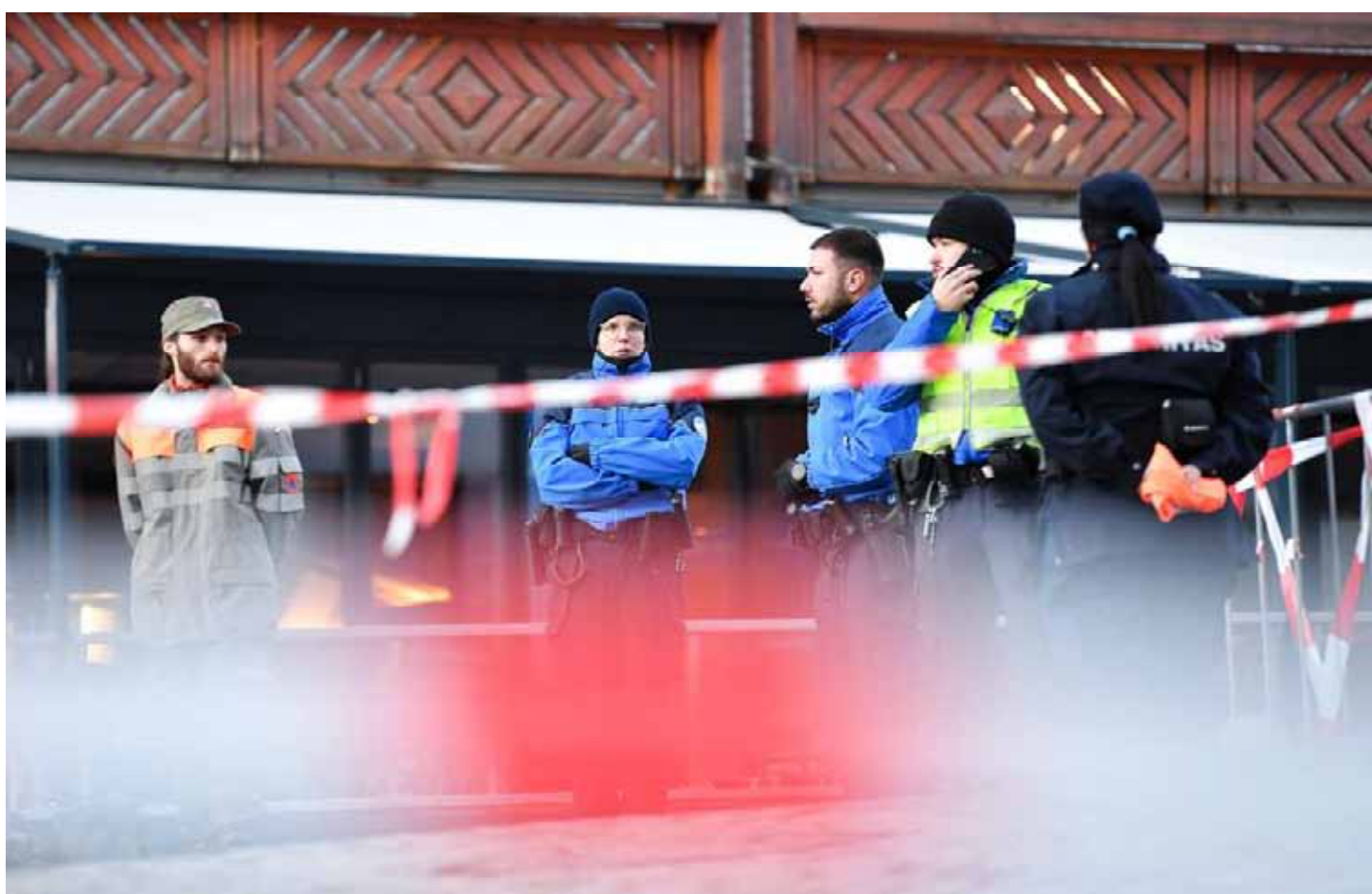
■ Horror en Año Nuevo. Decenas de muertos en las primeras horas de 2026.

ser publicado hoy. El mismo deberá ser tratado en el Congreso por la Comisión Permanente de Trámite Legislativo, que tendrá diez días hábiles después de que el Gobierno lo envíe. Página 3