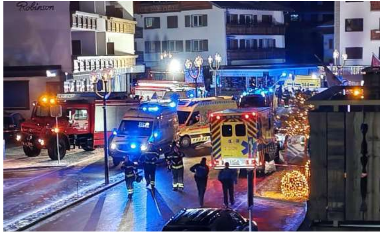
Horror. Las víctimas tendrían entre 15 y 20 años.

Se puso en marcha una investigación para determinar la causa de la explosión, pero las autoridades