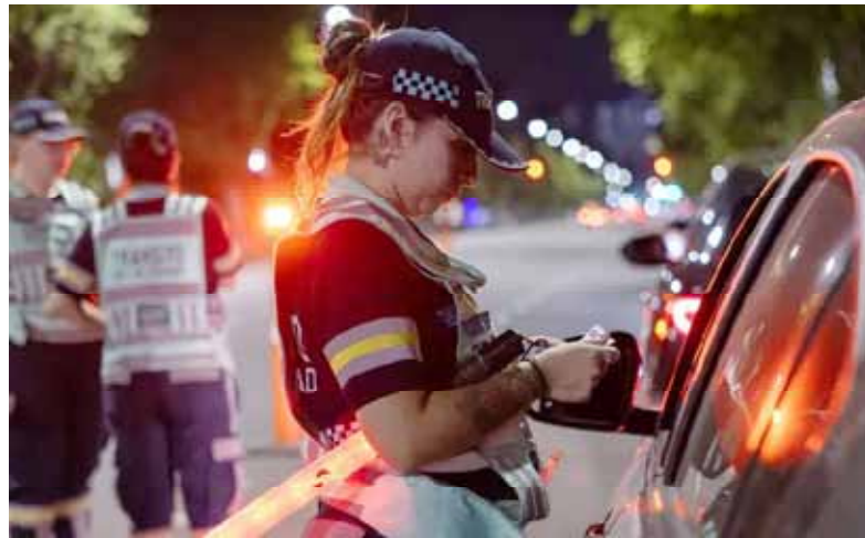
Complicado. Una agente de tránsito controla a un conductor detenido.

• 1,52 g/l en Villa La Angostura, Neuquén • 1,29 g/l en Las Grutas, Río Negro.